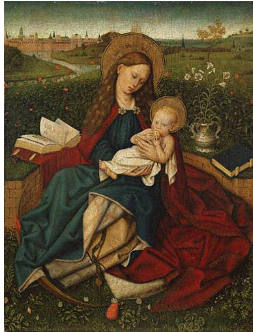
رؤبرت كامپن Robert